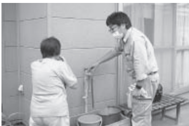
▲気になる外水栓を確認