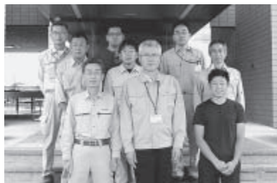
▲今回の点検メンバー

また、それぞれのお宅で気になるところを伺ったところ、多くのお宅で蛇口からの水漏れを相談されました。パッキンの交換で対応できるところは交換をしました。