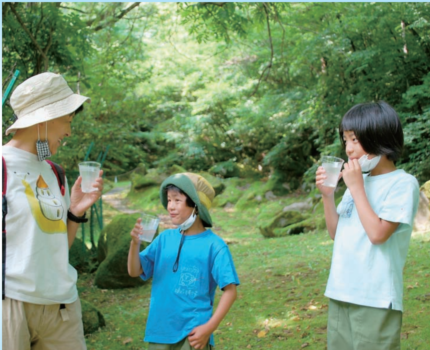
水道施設見学会 大石水源 (佐久穂町)