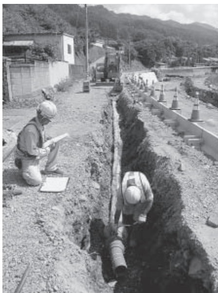
▶耐震管を布設している状況(大日向地区)