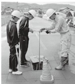
▼消火栓を操作する様子

企業団の概要や仕事内容の説明の後、配水課・工務課・給水課で水道施設の維持管理、水道管の布設替工事による断通水作業、給水装置工事の検査などを行いました。