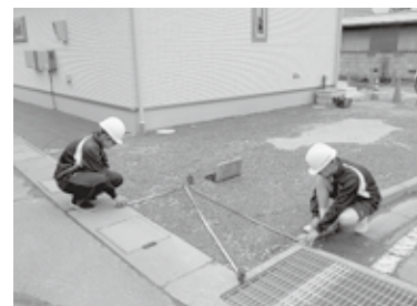
▲給水検査を体験する様子