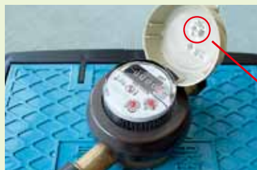
有効期限の満了表示

なお、取替えの費用は佐久水道企業団で負担いたします。 ※委託業者は企業団発行の委託証明書を携行しています。