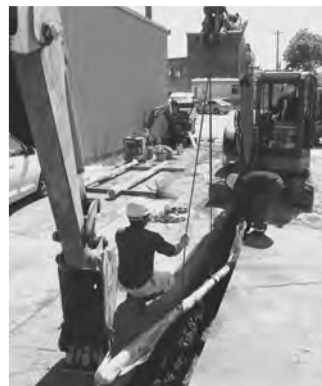
▲開削工事の様子(耐震管へ布設替)

皆様に安全・安心な水をお届けするために必要な工事となりますので、工事期間中はご迷惑をおかけしますが、ご協力をお願いいたします。