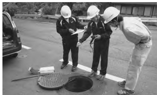
▲ピットに入る前の酸素濃度を確認する様子

事故やけがの防止のため、安全管理の方法の説明を受けながら作業を経験していました。