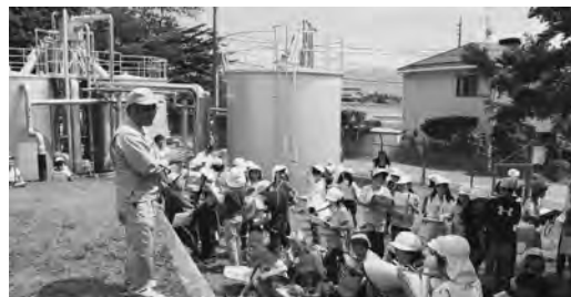
▲佐久平浅間小学校の皆さん 場所：御代田浄水場（御代田町）