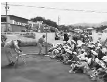
▲御代田南小学校の皆さん 場所：草越配水池（御代田町）

5月26日、佐久市の佐久平浅間小学校の皆さんが御代田浄水場に社会科見学を訪れました。企業団で3ヶ所しかない浄水場の一つを間近に見て、水をきれいにする方法など職員の話聞きながら児童の皆さんは熱心に学習していました。