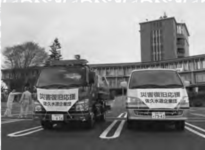
▲給水車とサポートカー