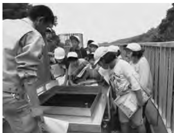
▲岸野小学校の皆さん 場所：沓沢配水池（佐久市）