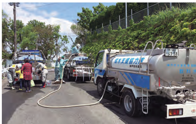
▲神戸市水道局より補水を受ける様子