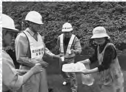
▲被災された方々からねぎらいをいただきました