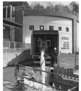
▲非開削工事の様子(ホースライニング工法)

企業団では、大規模災害が発生しても断水の発生を極力小さくするよう耐震性能を有した水道管の構築に力を傾注しています。給水車による水の供給には限界があります。そして、水道管路の延長も長く、都会のように住宅や工場が密集した地域とは違い、点在する地域の皆様にも、水道の便利さを享受していただけるような水道施設に取り組んでまいります。