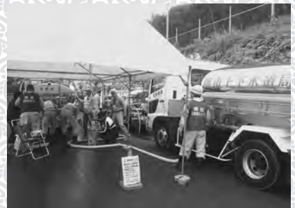
▲堺市上下水道局より補水を受ける